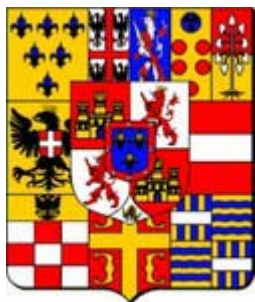
Карло II од Бурбон-Парме (1803-1883).