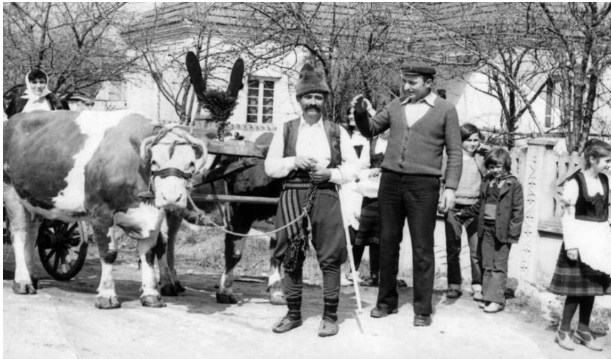
Teranje rube kroz selo

Momački svatovi su na svadbu pozivani „buklijom“, što je i danas običaj. Mladoženjin brat, otac ili rođak kreće sa okićenom buklijom od kuće do kuće kod onih koje poziva u svatove. Svako ko je pozvan, bukliju okiti peškirom, cvećem i parama a u jabuku, koja se nosi uz bukliju, zabadaju metalni novac.