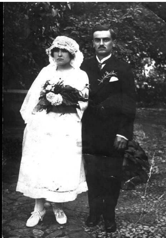
Mladenci u Jagodini 1923. godine