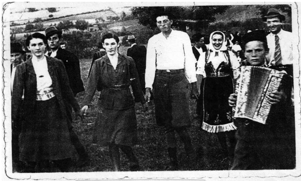
Kolo na saboru posle Drugog svetskog rata

Kec je bio od iste važnosti kao i kolovođa, i tu je uvek igrao momak. On je često uvijao kraj kola unutra te je ono dobijalo oblik spirale, koje se naizmenično uvija i vraća u prvobitni