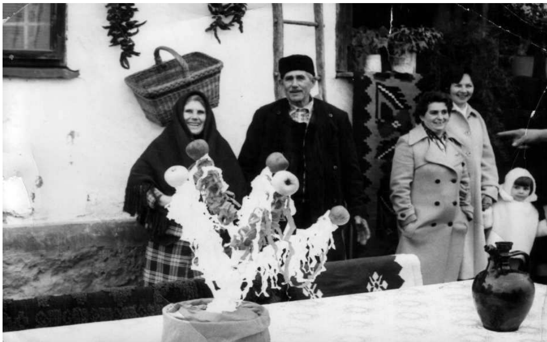
Sabornik koji treba polomiti i testija koju treba razbiti čime će se označiti kraj svadbe

Svadba se završavala šarenim kolom , a igrali su ga oženjeni i udate koji imaju dosta poroda. Postoje dva načina igranja ovog kola. Stariji igrački obrazac nosi naziv šareno kolo i igra se „ sve napred ”, a mlađi je igra „ ti momo, ti devojko ”. Šareno kolo se igra u ponedjeljak kad se „svadba rastura”. U selu Šuljkovcu starojko polomi sabornik i povede šareno kolo , do njega mlada, mladoženja, starojkovicica, kum, kuma... pa redom dalje.