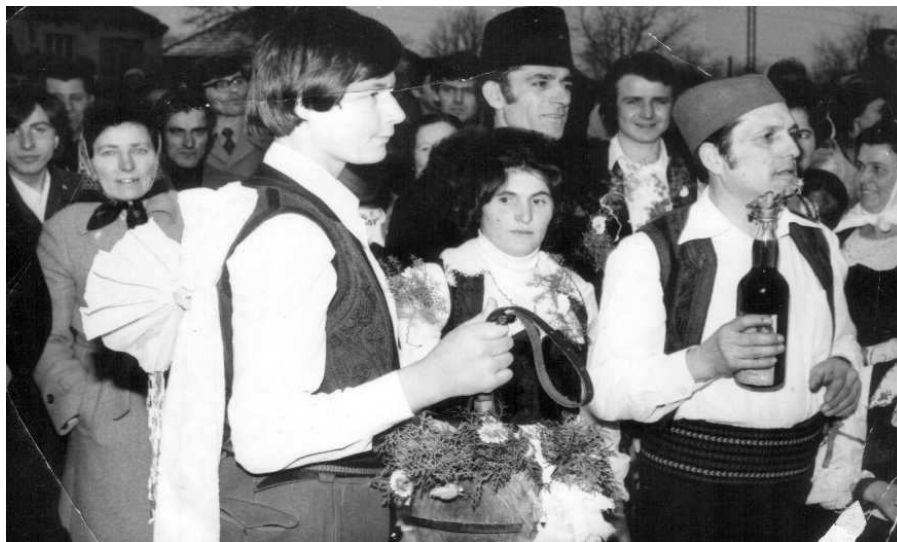
Zdravica ispred mladine kuće

Nakon dogovora dolazi se na „gledanje” devojačkoj kući. Ukoliko se devojka dopadne momku i momak njoj, roditelji se sastaju da „narede” proševinu gde se dogovaraju o mirazu. Zavisno od dogovora, posle jedne ili dve nedelje u mladinu kuću dolaze prosci i to mladoženja, otac, majka, stric ili ujak. Obično se išlo nedeljom i ostajalo na ručku. Mlada je bila dužna da daruje proscu košuljama, vezenim peškirimama, čarapama. Sve darove je morala svojom rukom da spremi pre udaje.