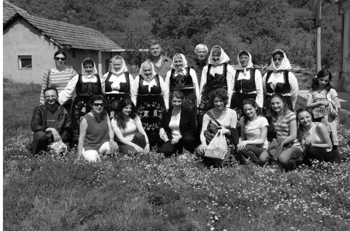
Učesnici projekta sa pevačima u selu Lovci

Među najznačajnije datume u životu pojedinca mogu se ubrojiti rođenje, inicijacija ili uvođenje mlađih članova u svet odraslih, zatim svadbeni običaji i na kraju smrt. Svuda su, pa i u Belici, ovakvi trenuci bili praćeni običajima, igrom i muzikom. Igranje tokom ovakvih običaja gotovo i da nije izlazilo iz okvira uobičajenog igračkog repertoara jednog kraja, tako da nema specifičnih igara u ovim prilikama, ali je u svakom slučaju igre moralo biti. Najviše se igralo pri proigravanju i na svadbi, dok igranja povodom rođenja i smrti nema u Belici.