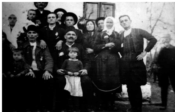
Svatovi između dva svetska rata

Prve pomene igara u Belici nalazimo kod Milana Đ. Milićevića, koji kaza da se u jagodinskom okrugu igralo „niševačko oro”, „paraćinka ostroljanka”, „Neda grivne”, „četvorka”, „polomka mačvanka”, „orlovka”, „Mara tilindara”, „valjevka”, „vlahinja” i „smederevka”. Belički kraj je izuzetno malo proučavan te daljih zapisa o igrama ovog kraja nemamo.