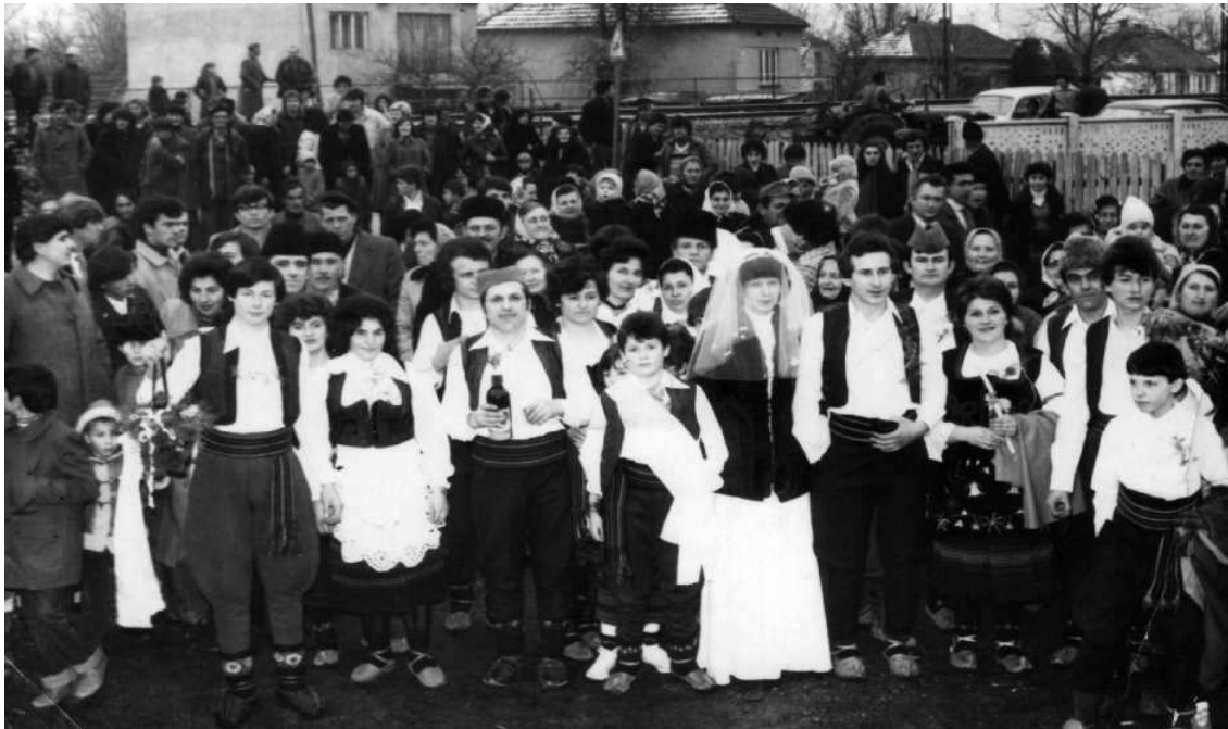
Svatovi u dvorištu kod mladoženje

U toku svadbenog veselja postojala je obaveza da svako od „starešina svatova” mora povesti jedno kolo.