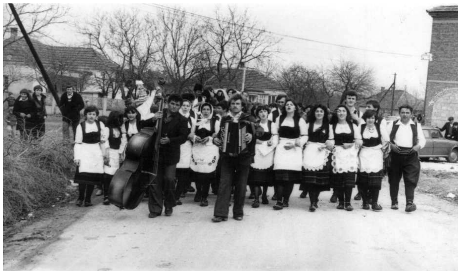
Svatovi idu po mladu

Starojko Boga moli omin, omin, omin! Za zdravlje mladencima omin, omin, omin!