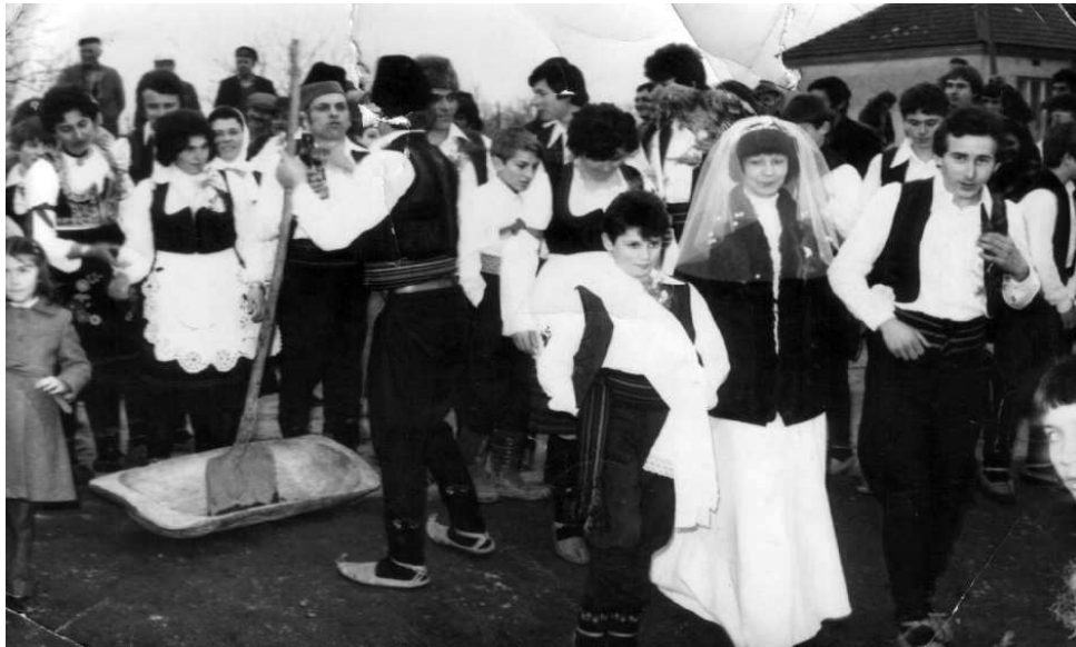
Ulazak u dvorište kod mladoženjine kuće

Pri dolasku sa venčanja i uvođenja u novi dom, uloga svekrve je bila veoma zapažena. Kod mladoženjine kuće svekrva uvodi mladu u novi dom, koja ispod pazuha drži dve pogače, a u rukama dve flaše vina, vodi je oko ognjišta i stavlja sebi u krilo. Na početku svadbenog veselja u domu kolo povede starojko sa mladom, a zatim se veselje nastavlja uz učešće ostalih svatova.