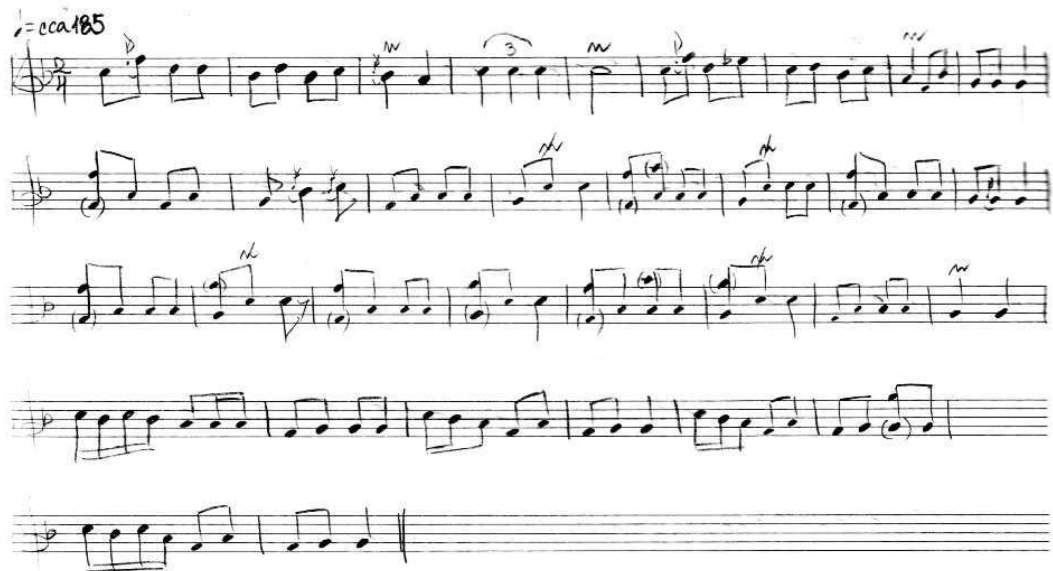
„Stara vlajna”, igra koja se igra na kraju svadbe kao šareno kolo