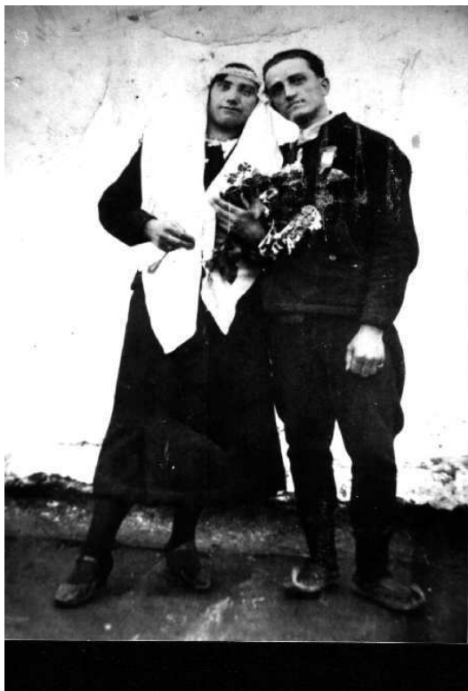
Mladenci u selu Bunaru

Na osnovu skorašnjih istraživanja, u Belici sam zateko sledeće nazive igara: „Prođe Mile”, „Čoban tera ovčice”, „Igralo kolo pod Vidin”, „Levačka šetnja”, „Žikino kolo”, „Pop Marinko”, „Šušakavac”, „Učitelju kolka ti je plata”, „Šareno kolo”, „Ti momo”, „Divna Divna”, „O, Jelo Jelena”, „Ajđ na levo brate Stevo”, „Ja posejah lubenice”, „Tries druga”, „Tajče”, „Nebesko”, „Drdanke”, „Zupčanka”, „Zavrzlama”, „Stara vlejna”, „Đurđevka”, „Zaplet”, „Moravac”, „Trojanac”, „Mala bašta”, „Šestica”, „Šokec”, „Čačak”, „Dunda”, „Kolariću paniću, devojčica vodu gazi.